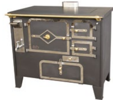
Rustilar 95 Fogão a Lenha Com caldeira à esquerda ou direita Chaminé ao centro, esquerda ou direita