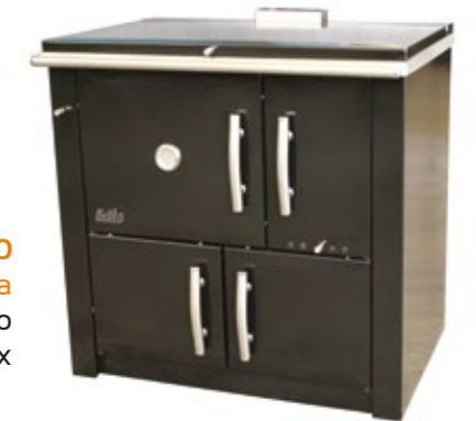
Medilar 90 Fogão a Lenha Esmaltado preto com mesa inox