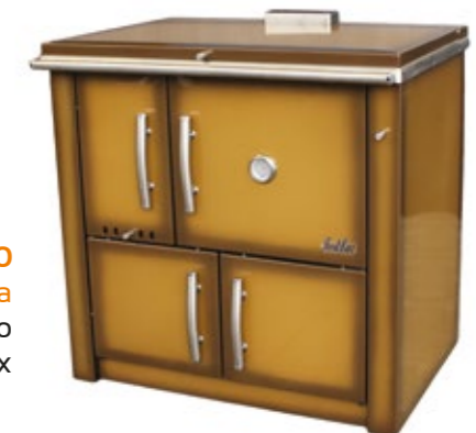
Medilar 100 Fogão a Lenha Esmaltado Castanho com mesa inox

Várias cores disponíveis Puxadores retangulares