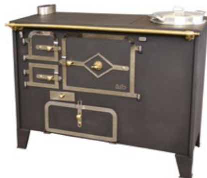
Rustilar 108 Fogão a Lenha Com panela à esquerda ou direita