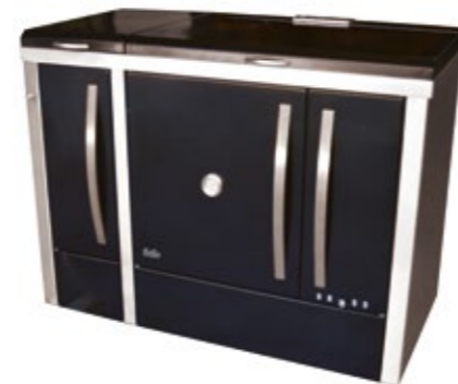
Megljar 120 Fogão a Lenha Esmaltado misto - 2B Opção inox