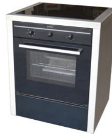
Fogão elétrico 4B Forno elétrico Esmaltado preto com lateral em inox