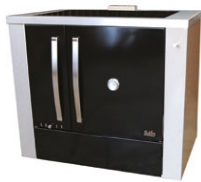
Megljar 100 Fogão a Lenha Esmaltado com lateral em inox Mesa vitrocerâmica