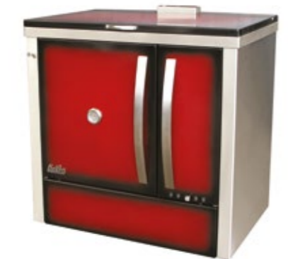
Megljar 90 Fogão a Lenha Esmaltado Bordeaux com lateral em inox