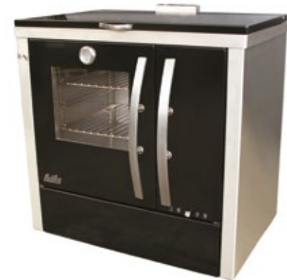
Megljar 90 Fogão a Lenha Esmaltado preto com lateral em inox e porta do forno em vidro