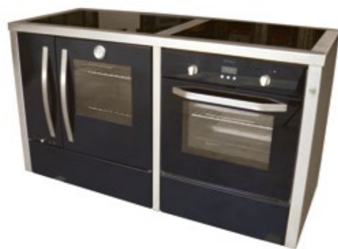
Megljar 155 Fogão a Lenha Esmaltado misto - 4B e forno elétrico Mesa vitrocerâmica Opção inox