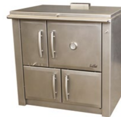
Medilar 90 Fogão a Lenha Inox com mesa inox