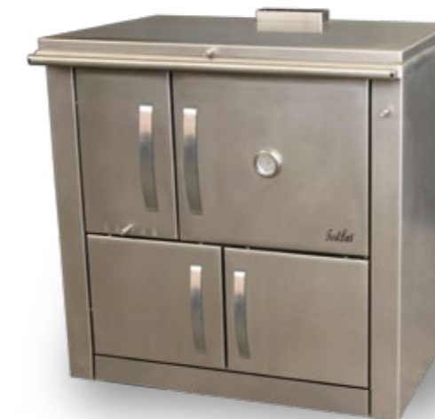
Medilar 90 Fogão a Lenha

Várias cores disponíveis Puxadores retangulares