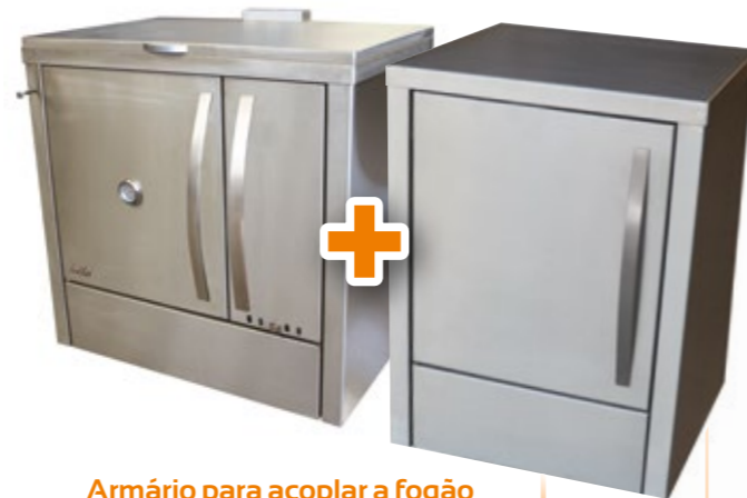
Armário para acoplar a fogão Inox, opção esmaltado L64xP61xA86