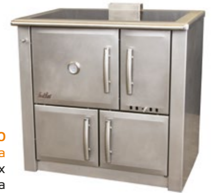
Medilar 90 Fogão a Lenha Inox Mesa vitrocerâmica