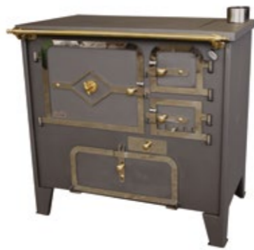
Rustilar 85 Fogão a Lenha Chaminé ao centro, esquerda ou direita