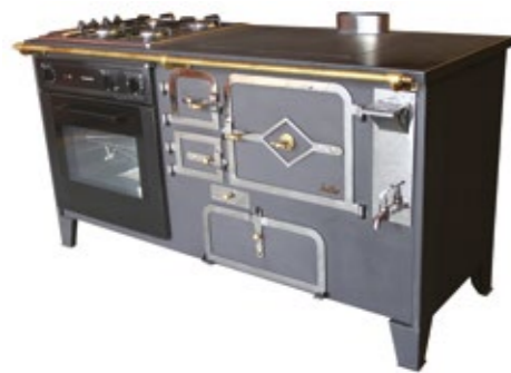
Rustilar 155 Fogão a Lenha Com caldeira, Forno elétrico 4B à esquerda ou direita