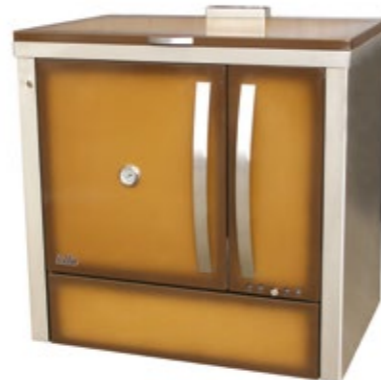
Megljar 90 Fogão a Lenha Esmaltado Castanho com lateral em inox